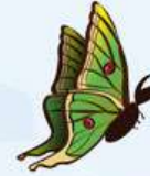
Arboreto Luis Ceballos