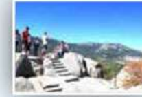
Silla de Felipe II